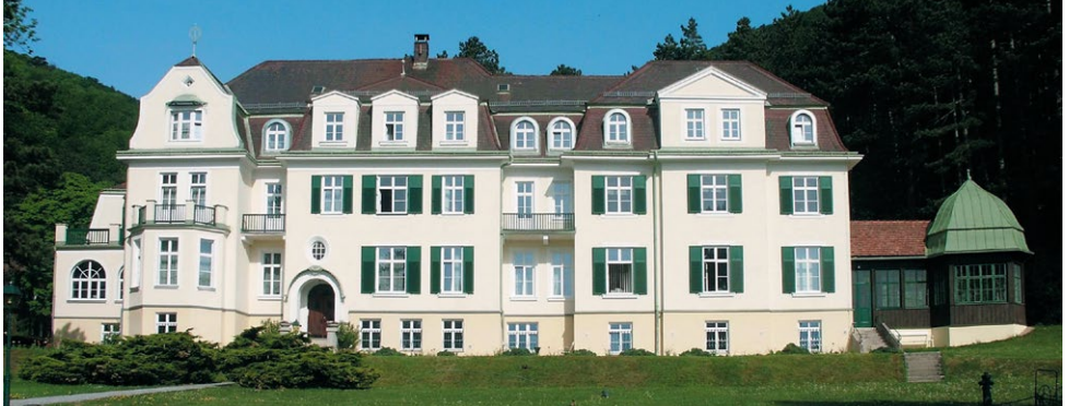
Centrala „AUSTROTHERM INTERNATIONAL“ (Wopfing / Austrija)