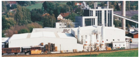
EPS-fabrika (Pinkafeld / Austrija)

„AUSTROTHERM INTERNATIONAL“ je internacionalna grupacija na čijem čelu je austrijska kompanija Austrotherm GmbH i koju još čine 11 njenih kćerki-kompanija iz 11 evropskih zemalja. Danas smo jedan od vodećih evropskih proizvođača termoizolacionih materijala na bazi EPS-a (ekspandiranog polistirena, tj. „stiropora“) i XPS-a (ekstrudirano polistirena) u srednjoj i istočnoj Evropi. Posedujemo širom Evrope 20 fabrika EPS-a i 4 fabrike XPS-a. Osim nabrojanog, bavimo se i proizvodnjom zvučno-izolacionih materijala, fasadnih profila i Wellness-elemenata (sve na bazi EPS-a), polietilenskih proizvoda kao i proizvodnjom specijalnih ploča (na bazi XPS-a) namenjenih unutrašnjim, odnosno završnim radovima u građevinarstvu.