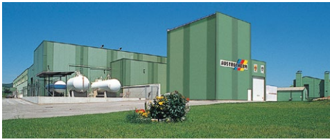
XPS-fabrika (Purbach / Austrija)