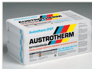
Ploča od ekspaniranog polistirena za različite namene

termoizolaciona ploča sa falcovanim ivicama