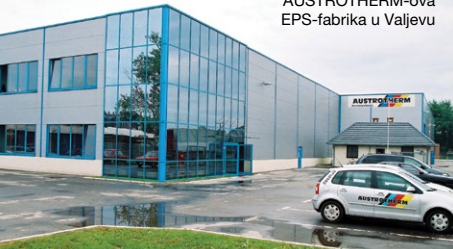
AUSTROTHERM-ova EPS-fabrika u Valjevu