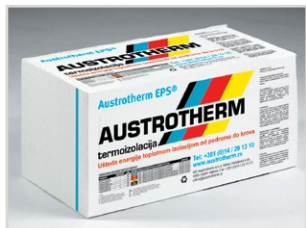
Ploča od ekspaniranog polistirena za različite namene